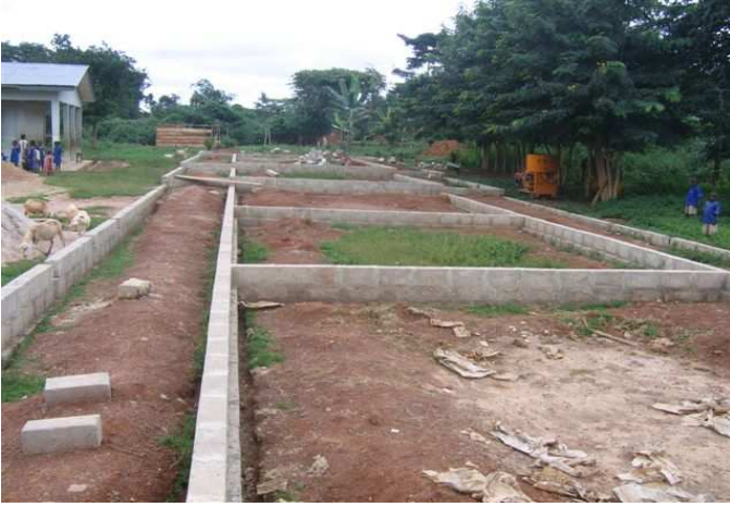
Fundering van de nieuwe school in Kensere