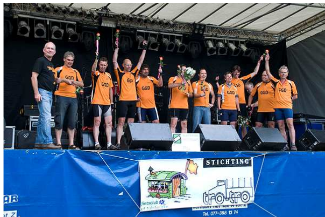
Fietsclub Ut Tuinhuuske na aankomst in Venlo

We zijn iedereen die zich voor het project heeft ingezet natuurlijk zeer erkentelijk. Overigens We zijn iedereen die zich voor het project heeft ingezet natuurlijk zeer erkentelijk.