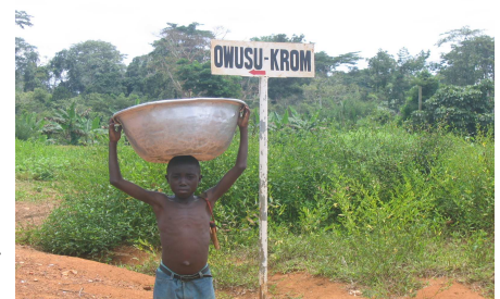
Waterhalen in Owusukrom

Een aantal jaren geleden heeft onze stichting in samenwerking met PICOSOL in het dorpje Twabidi een waterleidingsysteem aangelegd met behulp van zonne-energie. In het nabijgelegen Owusukrom bleef dit niet onopgemerkt; men wilde ook graag een dergelijke waterleiding. Want voor water zijn de dorpelingen aangewezen op bron op een paar honderd meter afstand heuvelaf van het dorp. Vrouwen en vaak ook kinderen moeten voor elke emmer een heel eind lopen om water te scheppen, dat ook nog eens vervuild is, met alle risico's voor o.a. cholera. Dus vroeg men hulp aan TRO-TRO. Natuurlijk moest deze aanvraag voldoen aan onze gebruikelijke voorwaarden, zoals de afspraak dat de inwoners zelf ongeschoolde arbeid leveren en dat het project de gehele gemeenschap dient. Via PICOSOL hebben wij een aantal gebruikte, goed werkende, zonnepanelen gekregen van ENECO, een energiemaatschappij met duurzaamheid hoog in het vaandel. Deze gift hebben we natuurlijk dankbaar aanvaard. Bij een bron nabij Owusukrom wordt een afgesloten waterreservoir gebouwd. Daarin wordt een pomp gehangen, die op zonne-energie (via de ENECO-panelen) het water oppompt naar een kunststof watertank op een hoger gelegen plek in het dorp. En van daaruit loopt er een waterleiding naar een centraal tappunt in het dorp waar men water kan tappen.