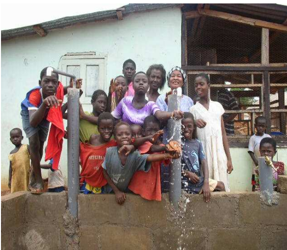
Blijde gezichten bij het TRO-TRO-waterproject in Twabidi

Ten behoeve van het project schoon water voor Owusukrom (zie ook bladzijde 4) ontvingen wij diverse donaties. Eind mei 2008 werd in Venlo-Oost, op speelplek Ut Greunveldje, een nieuw speelattribuut feestelijk geopend, namelijk een door kunstsmid Juul Baltussen ontworpen waterpomp. Het mechanisme in de pomp wordt ook veel gebruikt in Afrika en dat bracht de buurtbewoners op het idee om een actie te houden voor een pomp in dat continent. Het is immers niet overal op de wereld vanzelfsprekend dat er zomaar water uit de grond gepompt wordt, helemaal niet om ermee te spelen. Via een buurtbewoner kwam men uit bij TRO-TRO, die toevallig net de aanvraag uit Owusukrom ontvangen had. De actie 'Pompen voor een Pomp' bracht zo'n € 1.150,- op met behalve bijdragen van ouders en ander publiek bij het openingsfeest ook donaties van het Mondiaal Platform Venlo en het Waterschap Peel en Maas. De Venlose stichting de Kleierkas steunde het project ook nog eens met een forse gift.