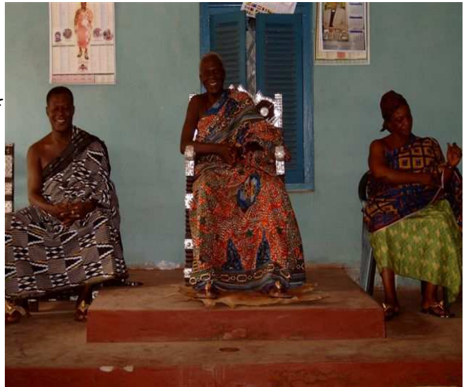
De Chieft, de queen-mother en één van de "nana's" (wethouder) van Hwidiem in vol ornaat

Inmiddels is er sprake van een trend, waar helaas ook negatieve aspecten aan verbonden zijn. Tegenstanders spreken over de devaluatie van het chieftaincy . Dat heeft deels te maken met het feit dat sommige development chiefs doen alsof de macht aan hen is overgedragen. Zij pronken met de naam en laten zich in westerse media als machtige koningen van een exotische stam portretteren, terwijl het een louter ceremoniële titel is. Maar ook binnen de Ghanese gemeenschap klinken enkele negatieve geluiden door. "Het is exploitatie van de Ghanese cultuur en onrespectvol. Het chieftaincy verwordt tot een financieel spelletje". Ook zijn er helaas voorbeelden van het misbruik maken van de titel door development chiefs , die ontvangen gelden deels in eigen zak steken. Maar gelukkig overtreffen de vele positieve voorbeelden van goed functionerende development chiefs ruimschoots deze negatieve ervaringen.