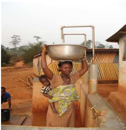
Schoon en stromend drinkwater voor het hele gezin. Het water is vanuit een reservoir opgepompt met behulp van zonne-energie, duurzaam en vrijwel onderhoudsvrij!

Recent ontving TRO-TRO een aanvraag voor de aanleg van een drinkwatervoorziening in Owusukrom, een dorpje met zo'n 800 inwoners, gelegen tussen cacaoplantages in voormalig tropisch regenwoud, vlak bij het voor TRO-TRO zo bekende Twabidi. Een pomp die werkt op zonne-energie moet zorgen dat er overdag twee grote kunststofwatertanks (8.000 liter) worden gevuld, die op het hoogste punt staan in het dorp. Vanaf die watertanks loopt er een waterleiding naar één centraal tappunt in het dorp. Daar kunnen mensen emmers water vullen en mee naar hun huis nemen. Per emmer water moet een klein bedrag betaald worden; van dit bedrag wordt het systeem onderhouden en wordt de persoon betaald die bijhoudt hoeveel emmers water elk huishouden gebruikt. Een dorpscommissie ziet toe op de besteding van het geld en zorgt ook voor het onderhoud.