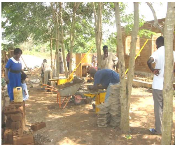
Langzaam maar zeker vordert de bouw van de school in Kensere